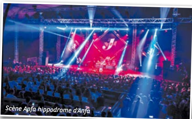
Scène Anfa hippodrome d'Anfa