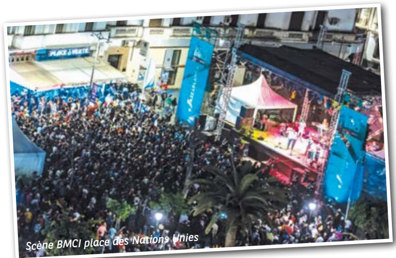
Scène BMCI place des Nations Unies

Rendez-vous en avril 2018 pour le plus grand plaisir d'un public toujours aussi fidèle !